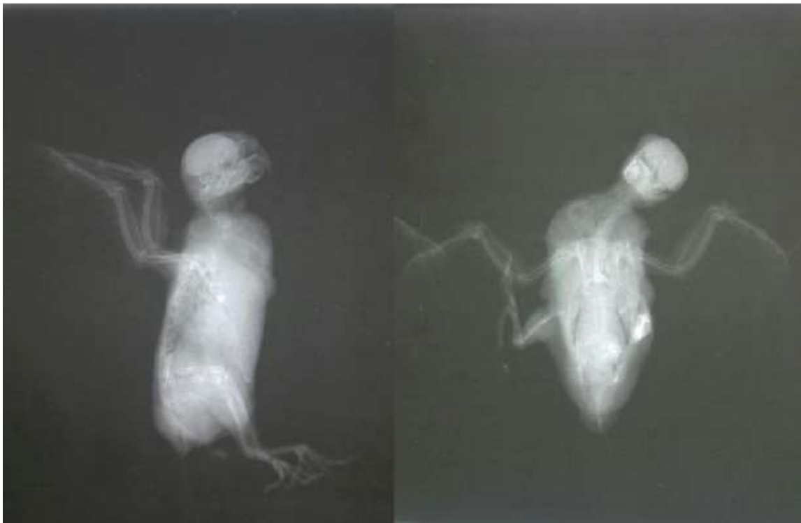
تصویر ۳: گرافی گروه ۱ درمان بعد از القای عصاره الکلی گیاه چای سبز