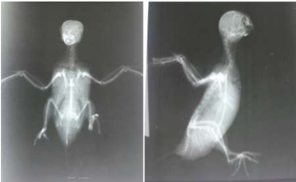
تصویر ۵: گرافی گروه ۳ درمان بعد از القای عصاره الکلی گیاه چای سبز