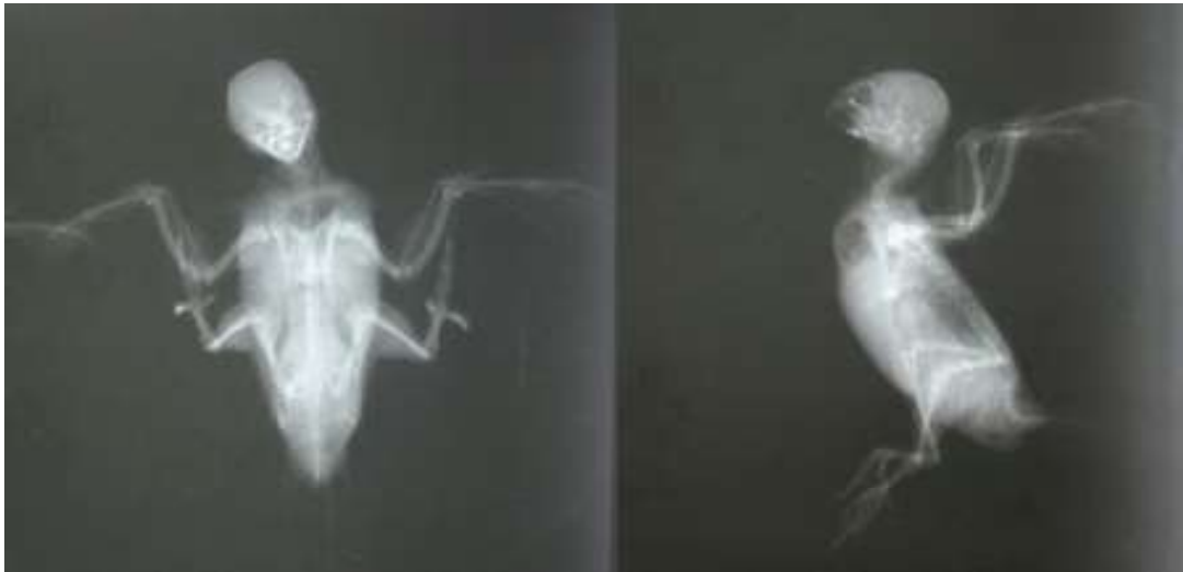
تصویر ۲: گرافی گروه کنترل مثبت

نتایج به دست آمده از رادیوگراف‌ها حاکی از آن بود که در تمام رادیوگراف‌های گروه‌های مورد مطالعه، استئوپروزیز در تمام استخوان‌ها به صورت نسبی مشاهده گردید که این میزان در استخوان‌های Ra- Ulna و در بال و Tibia و Fibula در پاها بیشتر از سایر قسمت‌های بدن مشهود بود و پس از اعمال درمان، روند ترمیم