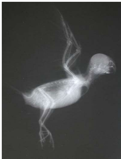
تصویر ۱: گرافی گروه کنترل منفی

این مطالعه ۲۰ جفت مرغ عشق با سنی بین ۱۰ تا ۱۳ ماه و وزنی حدود ۳۰ الی ۳۵ گرم انجام شد که بعد از گذراندن یک هفته دوره عادت‌پذیری، به صورت کاملاً تصادفی در پنج گروه تیمار متشکل از گروه کنترل منفی، کنترل مثبت و سه گروه تیمار تقسیم‌بندی شدند. تغذیه در تمامی پرندگان متشکل ۱۰۰ گرم دانه‌ی ارزن و تخم کتان به نسبت ۴ به ۱ بوده و آب مصرفی در دسترس برای پرندگان روزانه ۱۰۰ میلی‌لیتر و برنامه نوری در نظر گرفته شده برای گروه‌های مطالعه به صورت ۱۲ ساعت روشنایی و ۱۲ ساعت خاموشی لحاظ گشت. عصاره الکلی چای سبز مورد نیاز به روش ماسریشن تهیه و برای القای کم‌کاری تیروئید از متی‌مازول ۵ میلی‌گرم شرکت الحاوی ساخت ایران استفاده شد. دوز داروی استفاده شده برای هر پرنده ۰/۰۴ میلی‌گرم بر کیلوگرم بود که برای تجویز، دارو را با آب مقطر ترکیب نموده و به هر پرنده به میزان ۲۰ میکرولیتر از محلول خورانده شد. دارو به صورت روزانه و تک‌دوز به مدت ۳۲ روز به مرغ عشق‌ها خورانیده شد. تهیه عکس‌های رادیولوژی در دو زمان قبل و بعد از تجویز عصاره الکلی چای سبز انجام شد. رادیوگراف‌ها با استفاده از دستگاه IPS ساخت کشور ایتالیا با اعمال فاکتورهای تابش 40 kV و ۲.۵ mAs انجام شد. حالت گماری به صورت Lateral و Ventrodorsal اعمال گردید. تصویربرداری اول در روز ۳۳ و تصویربرداری دوم در روز ۴۳ آزمایش انجام گردید.